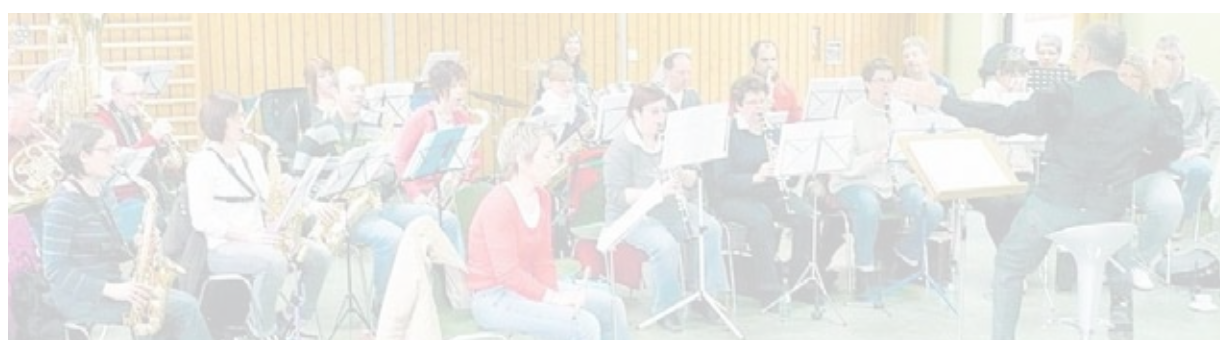
Die Orchestergemeinschaft hat zur Vorbereitung des Konzerts zahlreiche Proben absolviert.

die Idee der Freiheit.“ Dem Landesvorsitzenden der Grünen, Hubert Ulrich, wurde ein Buch von Peter von Matt mit dem wenig schmeichelhaften Titel „Die Intrige – Theorie und Praxis der Hinterlist“ überreicht. „Wer erfolgreich intrigiert, verfügt über viel Einfallsreichtum, Raffinesse, Klugheit und Power. Gute Voraussetzungen für die Politik“, steht dazu in der Begründung. Eher optimistisch fiel das Geschenk für den Vorsitzenden der Saar-SPD, Heiko Maas, aus: „Macht's besser – Die Welt verändern und das Leben genießen“ solle man gelesen haben, wenn man „die große Welt oder auch nur das kleine Saarland verändern will“. Oskar Lafontaine (Die Linke) hingegen musste Kritik einstecken. „Wer's glaubt wird selig“ von Dieter Nuhr sollte seinen Wahlkampf beschreiben. Der Kommentar hierzu: „Der Buchtitel sagt alles!“ ian